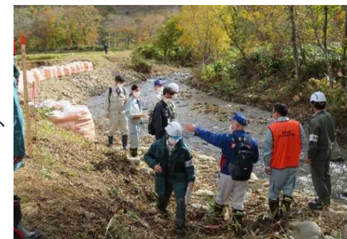
災害査定立会の様子

また、被災地の早期の復旧・復興を支援するため、使用可能な国有財産の提供(無償貸付等)、迅速かつ適正な災害査定立会、財政融資資金の貸付等を実施。