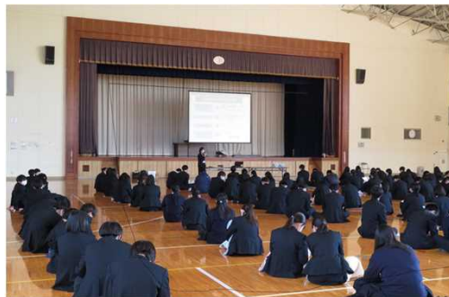
高校での出前講座

金融犯罪被害防止に向け、悪質な投資勧誘等に関する注意喚起、無登録業者に対する警告、預金口座の不正に係る情報提供を実施。