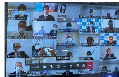
離島航路の維持・活性化の取組 四国運輸局、JRTTと共催で オンラインセミナーを開催

財務局のネットワークを活かし、地方公共団体等の地域課題解決や地方創生に関する取組について業務を通じて支援。地域において、事業者、金融機関、地方公共団体、独立行政法人、官民ファンド、政府機関等の各主体のつなぎ役を果たし、財政健全化や地域経済活性化に向けた取組を実施。